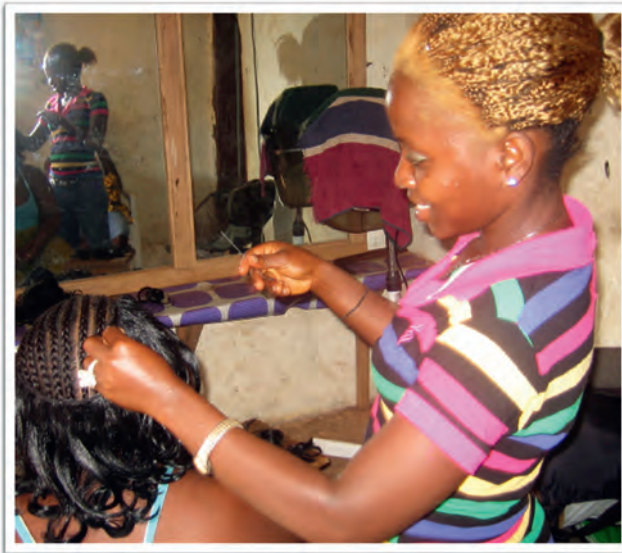
»Microenterprise«-Programm – Friseursalon

suren kreiert und Kosmetikartikel verkauft. Auch Kursteilnehmerinnen aus dem CESPRO-Programm absolvieren hier ihre Praktika. Das Programm tritt in Vorkasse für die Materialien. Der Verkaufsgewinn wird zum Teil an die Jugendlichen ausgezahlt, ein anderer Teil wird für sie angespart. Damit können sie dann später ihr eigenes kleines Geschäft eröffnen, und die nächsten Absolventinnen der Kurse übernehmen die Mini-Geschäfte.