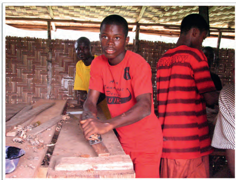
Arbeit in der Schreinerei

beitete in den ersten Jahren mit Straßenkindern, die allein gelassen und vom Krieg gezeichnet waren. In sogenannten »Hoffungsclubs« versuchten wir, den Kindern Beistand zu geben und sie zu unterrichten. Wir fingen mit 60 Kindern an und konnten diese Arbeit dann ausweiten. Am Ende betreuten wir über 200 Kinder und Jugendliche. Dieses Betreuungsmodell wurde dann auch von anderen Kommunen im Land übernommen. Wir haben auch festgestellt, dass das nicht genug war. So begann ich 2004 mit der Arbeit am »Brighter Future Children Rescue Center« in Buchanan, das die vom Krieg gezeichneten