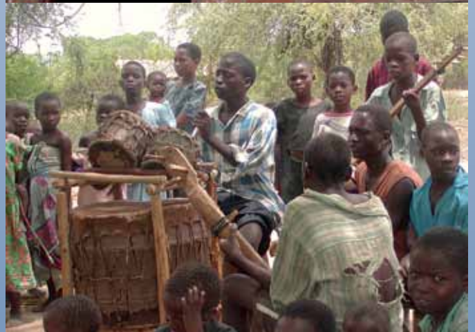
Gottesdienst auf dem Land unter Bäumen