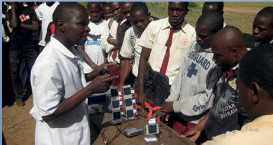
Solartechnik wird Schülern erklärt

5005 Gerechtigkeit, Frieden und die Bewahrung der Schöpfung