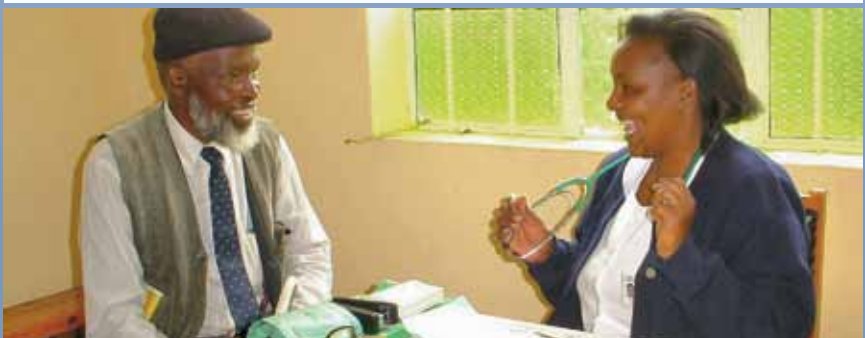
Aids-Beratung und Aufklärung in Maua