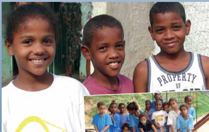
Kinder von Amas Niteroi, BRASILIEN